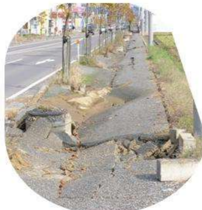
地表が陥没した管路