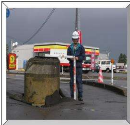
1m浮上したマンホール