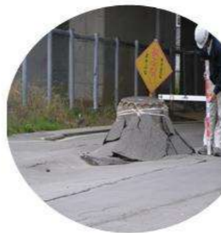
車道中央のマンホール